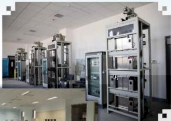
智能电梯安装调试维护训练场所