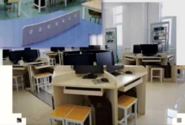
一体化课程教学设计综合实训室