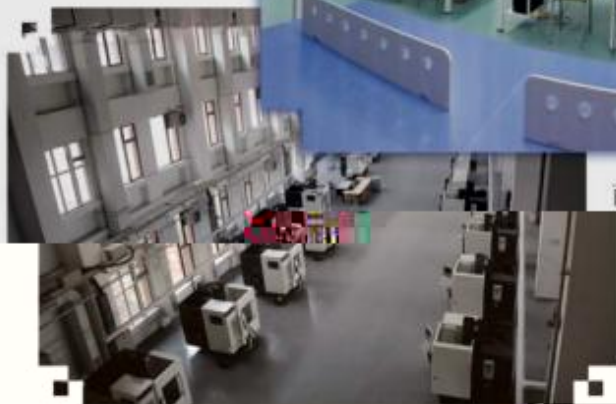
DMG 数控技术训练场所